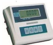
KPZ 52E-8 KPZ 52-18